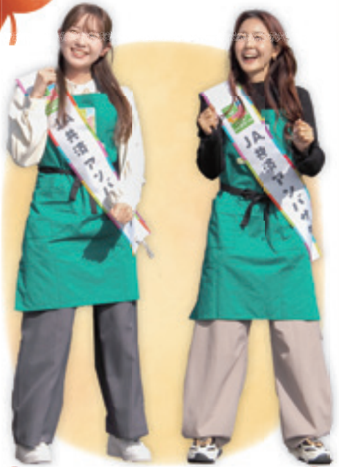
JA 共済アンバサダー