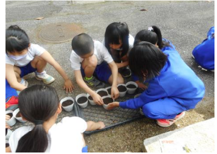
【3年生 理科 種まき】