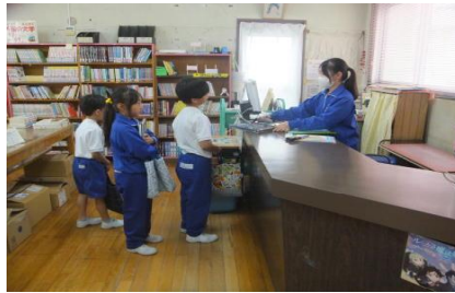
【委員会活動の様子】