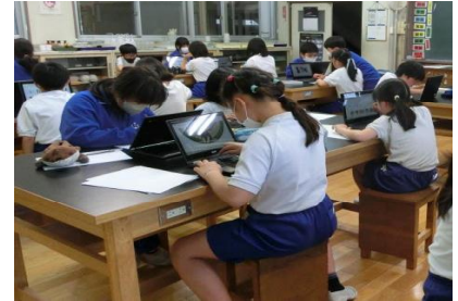
【クラブ活動の様子】