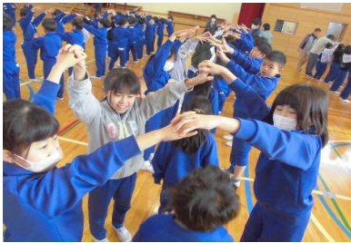
【1年生を迎える会の様子】