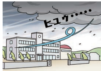
急にヒヤッとした冷たい風が吹いてくる。