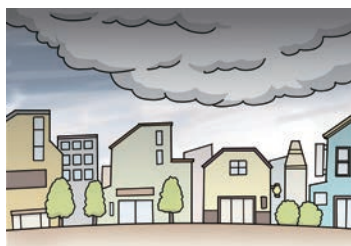
黒い雲（積乱雲）が近づいてきて、辺りが急に暗くなってくる。

こんな時は発達した積乱雲が近づいています 急な大雨・雷・突風などの危険 に注意！