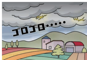
近づいてくる雲の中から、雷の音（ゴロゴロなど）や光が見えたりする。