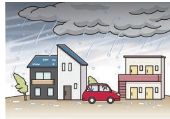
大きなつぶの雨や雹（ひょう）（小さな氷のかたまり）が降りだす。