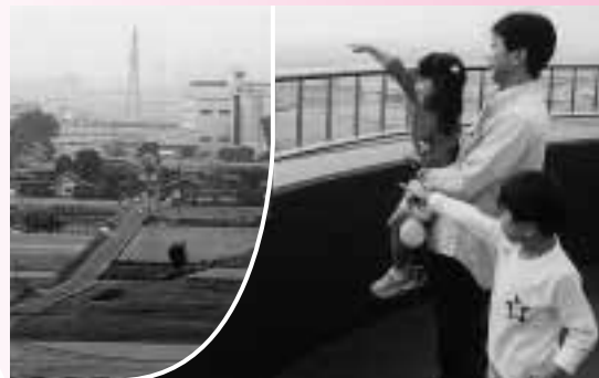
配水塔からの眺めを楽しむ親子

町では10月5日、町制施行4周年にあわせて水の大切さを理解してもらおうと南大島浄水場を一般開放しました。 今回は、町内外から親子連れなど155人が訪れました。会場では、管理棟内部の公開や町内各浄水場の写真紹介をはじめ、ヨーヨー、綿あめのサービスタなどが行われました。また、配水塔に登ったかたは高さ約30mからの眺めを満喫していました。来場者は「施設見学は水の大切さを考えるよい機会です。私も節水に心掛けたいと思います」と話していました。