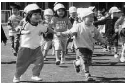
陣取りゲームで元気に走りまわる保育園・幼稚園園児

10月22日さわやかな秋空のもと、明和幼稚園・保育園の交流会が両園共通の園庭で行われ、3歳から5歳の園児約275人が年齢ごとに一緒に運動を楽しみました。この会は、合築された園舎に通う両園児に運動的な遊びを通じてふれあい、交流を深める目的で開催されるもので今回が3回目。 3歳児は陣取りゲーム、4歳児が空きペットボトルを使ったサッカー、5歳児は玉入れを仲良く行いました。参加した園児たちは終了後「楽しかったよ！」と元気に話してくれました。