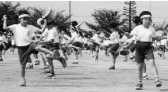
保護者の手づくり太鼓でエイサーを踊る西小児童

秋晴れの9月29日、東・西小学校の各家庭で運動会が開かれました。両校とも学年を超えた紅白対抗や団対抗で行い、一段と結束力を発揮し白熱した競技を展開しました。東小では、紅白対抗リレー