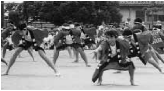
力強いソーランを披露する東小児童