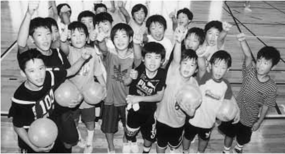
未来を担う子どもたち