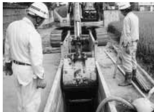
着々と進む公共下水道事業枝線管渠 築造工事