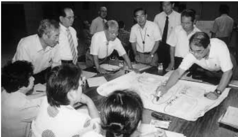
新めいわ創造プラン策定懇談会でまちの将来像づくり