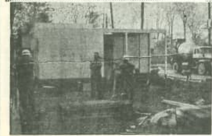
磁石交換から自動ダイヤル式に切りか えられる。川俣電話局自動ダイヤル無人局 設置工事は急ピッチで行なわれています。