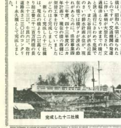
完成した十二社橋