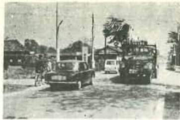
交通安全対策の一環として国道12号線柿田自転車駅前...