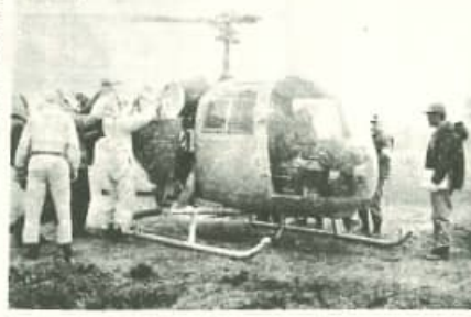
写真は昨年実施した空中散布の農業つこみ作業

今年も空中散布を実施 二十日から三日間 会談を閉じた結果、今年も三月十日から三日間、村全境に対して実施されることになり