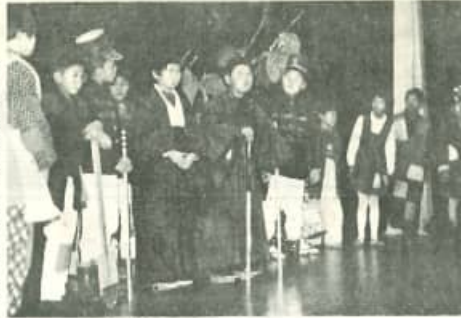
日頃の勉強ふりを一生懸命ひろうしました(四年生による歌を忘れた村)