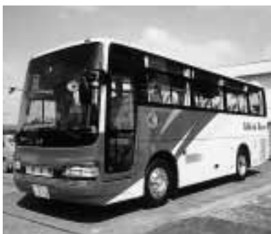
導入した町有バス

町では、このほど従来の研修用マイクロバスが老朽化したため、新車への買い替えを行いました。購入したバスは、定員29人乗りの日野セレガR中型バス。国の排出ガス最新規制適合車のディーゼル車で、車体は従来のバスより若干大きく座席やトランクにゆとりがあるのが特徴です。バスの使用運営は、従来と同様、管理規定に基づき運営されます。