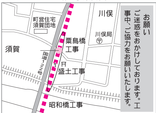
道路工事事案内図

工事を行います。 昭和橋の工事 群馬県側の堤防 部に、埼玉県施工による橋の土 台を造る工事を行います。 問い合わせ 館林土木事務所工 務第2グループ ☎(72)4355