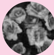
プリムラ・ポリアンサ

これから見ごろ プリムラ・ポリアンサ (12月上旬～4月中旬) 草丈 20～30cm 花径4cm内外の大輪種 花色 赤、青、黄、 橙、桃、紫、 白、褐色