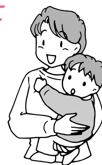
平成15年度乳幼児健診予定表