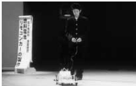
自作したリモコンカーを実演する生徒

県指定「研究開発校」の館林商工高等学校では2月14日、第3回課題研究及び学習成果発表会をふるさと産業文化館で行いました。 これは、3年生が授業の中で、自ら取り組んできた成果を合同で発表し、地域の人に広く知ってもらおうのが目的。電子機械科の『燃料電池リモコンカーの製作』をはじめ6組がスライド等を使い、個性豊かに発表。会場の1・2年生や保護者ら約500人は、熱心に耳を傾けていました。