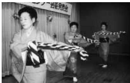
練習の成果をを披露する大佐貴老人クラブの皆さん

2月27日、老人福祉センターで町および町社会福祉協議会が主催する毎年恒例の芸能発表会が開かれ、235人が歌や踊りを楽しみました。 発表には各地区の老人クラブから32組のお年寄りがエントリし、日ごろから練習を重ねてきた歌や踊りをステージで熱演しました。 また、町ボランティア連絡協議会の協力により、ひとり暮らしのお年寄りも会場に招かれ、発表を鑑賞して楽しいひとときを過ごしました。