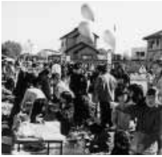
昨年行われた産業祭

出納整理期間とは：… 地方自治法の規定により、会計年度終了（3月31日）後、翌年度の4月1日から5月31日までの2か月間をいいます。