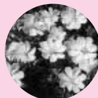
ヒルザキツキミソウ

6月の播種 ヒルザキツキミソウ (開花7月中旬) シュッコルピナス (開花6月中旬) キバナコスモス (開花6月上旬~11月上旬) など