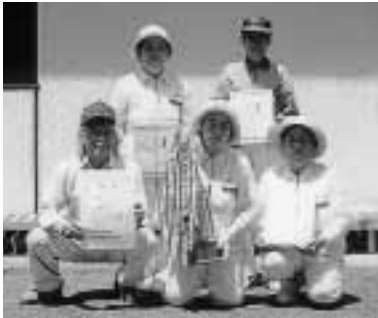
優勝した千津井チーム