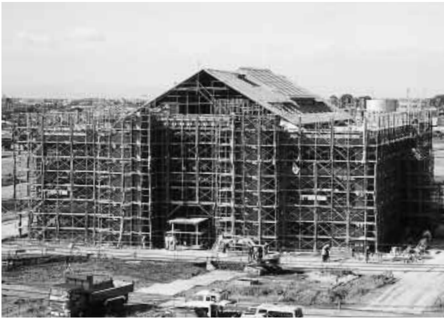
10月下旬の新庁舎建設状況

この公表は、財政概要の作成および公表に関する条例（町条例第35号）に基づき、町の財政状況をお知らせすることにより、町政の実態と町の主要施策についてご理解いただき、町政の発展についてご協力を得るため、定期的に公表しているものを広報に掲載するものです。 今回は、平成16年度上半期（4月～9月）における予算の概要、町有財産および町債の状況、住民の税の負担状況についてお知らせします。