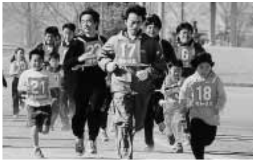
家族で元気にスタートだ