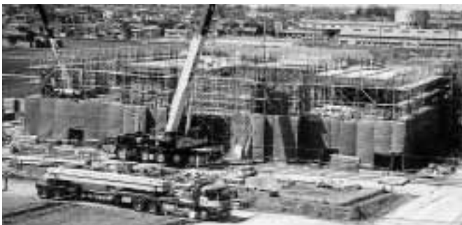
着々と進む役場新庁舎建設工事