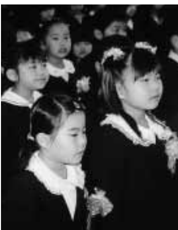
未来を担う子どもたち

普通建設事業費とは、道路・河川等の公共土木関係施設、消防施設、学校等文教施設、農林水産施設等公共用施設の新設・増設などの事業費です。