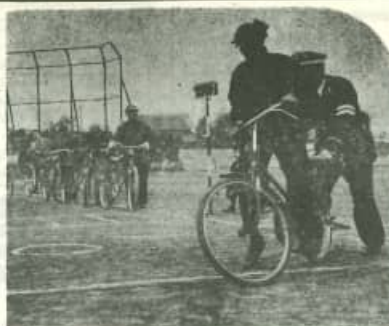
ハンドルを持つ手も真剣に

春の交通安全運動が実施中、和申中学校区で、お年寄りのための交通安全教室が開かれました。七日午前十時から、交通安全教室が開かれました。