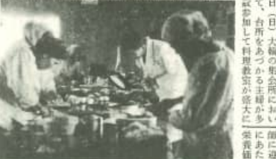
この料理教室が盛況に開催されています。

近年における社会、経済のうつりかると共に、主婦の生活もその影響を受けて、重要な役割を担っています。料理教室が盛況に開催されています。