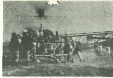
ヘリコプターに農薬つめこみ作業 フワゴロコバエを撲滅するヘリコプターは、農薬を散布する。ヘリコプターは、農薬を散布する。ヘリコプターは、農薬を散布する。

稲作の増収をはかるため、農により、ヘリコプター三機で、三月十六日フワゴロコバエ撲滅の空中から三日間、ヘリコプター三機布を実施しました。