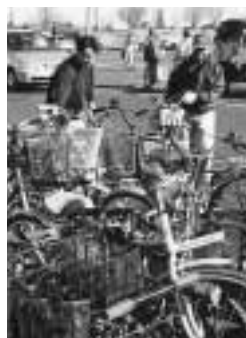
12月に行われた粗大ごみ収集