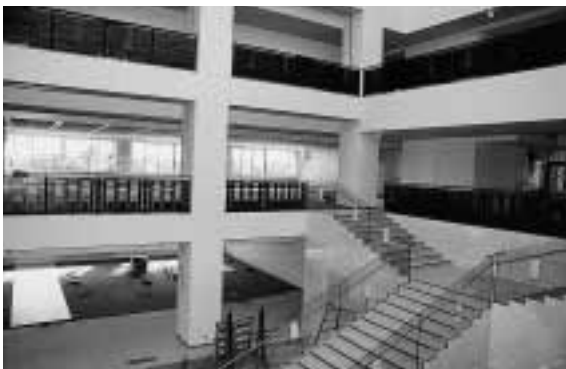
新庁舎吹き抜けスペース

町では、1月号の広報紙でもご案内しましたが、行政への町民参加の新しい形として、住民参加型ミニ市場公募債「めいわ愛町債」を発行することになりました。このほど「めいわ愛町債」の利率が、年0・76%と決まり、募集を2月15日(火)から始めます。購入されるかたは、直接取扱金融機関でお買い求めください。預貯金金利が非常に低い経済状況のなか安全確実な愛町債を購入して、まちづくりに参加してみませんか。あなたの資金は「町政の拠点となる身近な新庁舎建設事業」に生かされます。