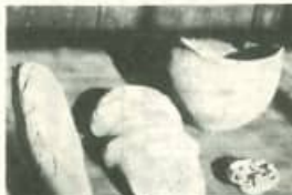
遺跡の調査が行われ、その結果、この遺跡は、二ヶ所から出土した、矢島遺跡は、二ヶ所から出土した、矢島遺跡は、二ヶ所から出土した。

本村で最も古い埋蔵文化財遺跡として、矢島遺跡。遺跡の調査が行われ、その結果、この遺跡は、二ヶ所から出土した、矢島遺跡は、二ヶ所から出土した、矢島遺跡は、二ヶ所から出土した。