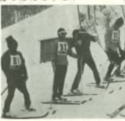
スキー教室の指導風景。インストラクターが丁寧に指導している。

今年も体協主催のスキー教室が一月十九日から二十一日まで、二泊三日で、尾根スキー場を会場として開かれました。参加者は、初心者から上級者まで、それぞれに合わせた指導を受け、上達しました。