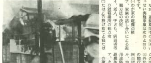
火災現場の様子。消防隊員が放水作業を行っている。周囲には警戒線が張り巡らされている。