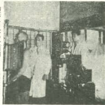
結核予防レントゲン撮映 ( 大 学 栞原光明寺にて )

結核は日本の亡国病とまで言はれ、又不治の病と言はれるが、これは誤りで、結核と謂えども不治の病ではない。ただ初期には自覚症状(自分で病気を感ずることがない)ため、他の病気の様に頭が痛むとか、腹が痛いとゆうのでなく、胸も何処も痛くもかゆくもないので知らず知らず病気が進んで二期三期となり、結核だと言はれた時はすでに手遅れになってしまふのです。