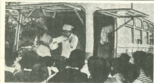
ツチンカー（栄養指導車）が来て色々農家の欠かんとして、たんぱく質カルシウム、有色野菜が不足して居るとのことです。

蚊とハエのいない生活を想像しただけで、何か清々とした薬味を感じさせられます。こんな生活があったら人生は本当に楽しいことだらう。 蚊もハエも夏には付もの、蚊やりをたき、団扇で、ハエを追いながらの食事、何んと非文化的なことだらう。 現代は原子力の時代といわれるのに、昔ながらのこの生活から抜け切れないのか？ この間六月六日から三日間明和村三ヶ所で蚊とハエをなくす運動の映画会を開きました。これは村民の各々が総力をあげてやろうとゆう決意さえあれば立派に蚊もハエもなくする事が出来る自信を得た事と思ひます。 村では財政困難な中から蚊とハエの撲滅に約三〇万円の予算を組み、各衛生部長を中心に青年団の勤労奉仕によって努力して居ります。一戸平均して徹底的な駆除を行ふのには一戸約五〇〇円を要すると言はれますので三二四戸では撲滅は困難です。そこでどうしても各家庭の自発的な駆除がなかつたら蚊もハエも