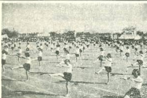
明和村各中学校生徒三年生による(体育する少女)美しいリズムに乗っての舞踊体操

消防団の支度競走はさすがにお家芸だけに、鐘がジャント鳴ればサツト飛出す素早さ、その他一般の親子競走や二〇〇才競走、婦人会の華やかな舞踊、小中学生のダンス、佐中生徒代表のマツ