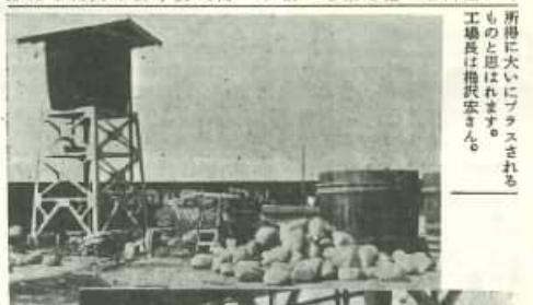
写真説明 上 漬物工場の一部 下 漬物の乾燥風景

最近工場建設に躍如の昨今、所得に大いにプラスされるものと見込まれる。新進漬物工業株式会社は、出、農産物の加工に乗り出した。同工場は現在敷地七五〇坪あり、二七五立方メートルのコンクリートタンクが三〇基と地上に三石積の構一七本にて、本七月より創業開始したが、胡瓜七〇万キロ、茄子一〇〇万キロ、ラッキョウ一四〇、〇〇〇を積み込み、現在約五〇名の工員が働いて居ります。