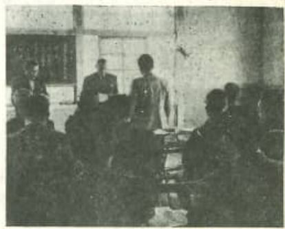
水陸稲とも新記録樹立

青少年の不良化を防ぐに は、まず、学童の生活環 境を整えることが重要で ある。学童の生活環境は、 家庭、学校、社会の三者 によって形成される。家庭 では、親の愛情と厳しさを 併せ持つことが大切であ る。学校では、教師の指導 と生徒の自主性を伸ばす ことが重要である。社会 では、青少年の健全な成 長を支援する環境を整え ることが必要である。