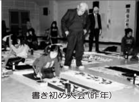
書き初め大会(昨年)