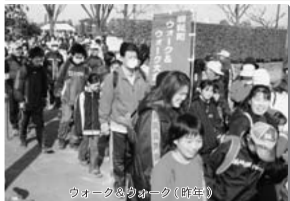
ウォーク&ウォーク(昨年)