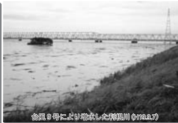
台風9号により増水した利根川(H19.9.7)