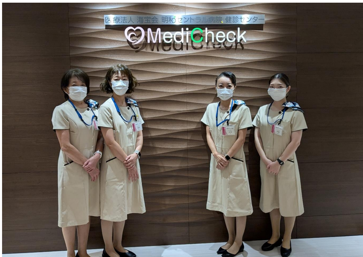
【コンシェルジュの皆さん】