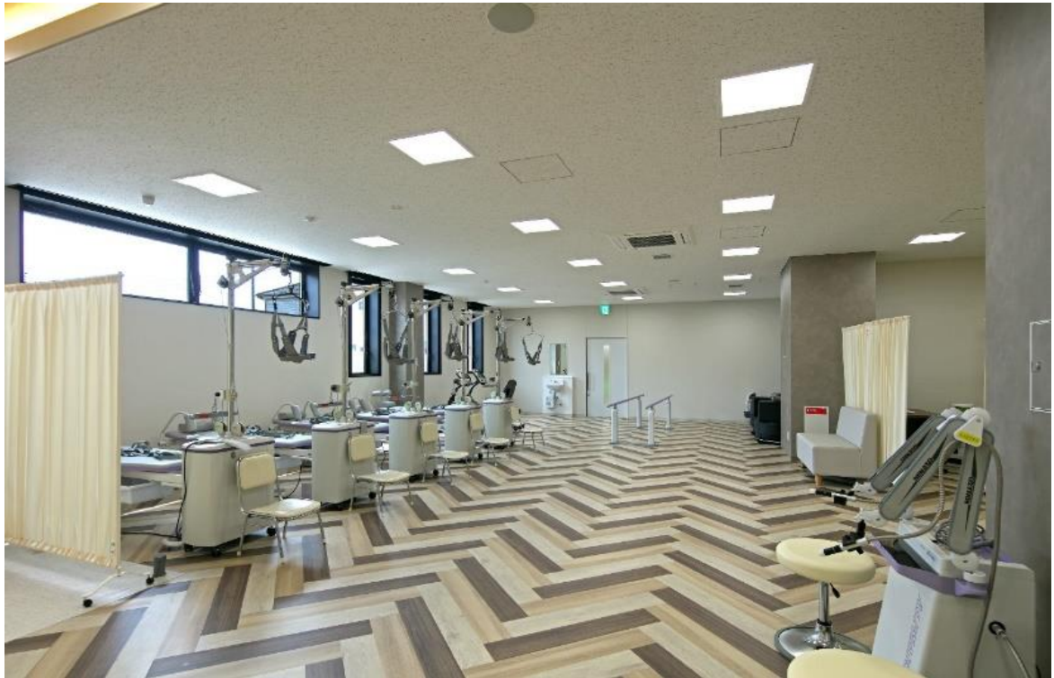
【整形外科リハビリテーション室】