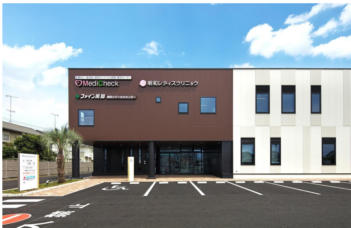
【明和メディカルセンタービルC館西口】

そして何より驚いたのは、健診センターに案内係(コンシェルジュ)が常駐しており、まるで豪華なホテルのような丁寧な接遇が行われていることです。4名のコンシェルジュが、着替えや受診コースの案内、待ち時間中のサポートなどを行い、受診者の皆さんが安心して検査を受けられるよう心配りをされています。