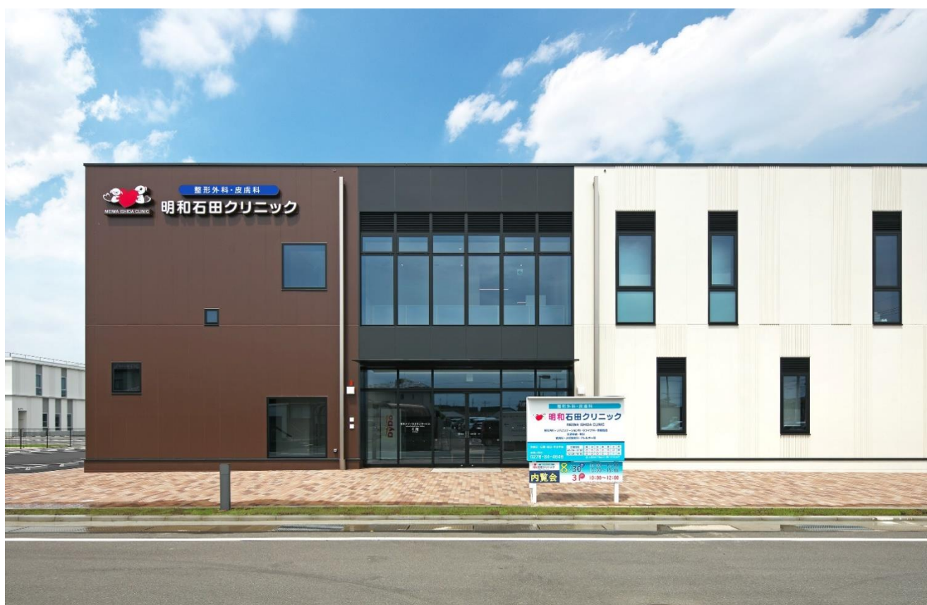
【明和メディカルセンタービル C 館南口】

9月1日、明和メディカルセンタービル C 館が開業いたしました。この C 館は、A 館・B 館に続く明和町3棟目の医療複合施設としてオープンしたものです。1階には「明和石田整形外科・皮膚科」、「ファイン薬局」が入り、2階には産婦人科の「明和レディースクリニック」と協会けんぽ指定の健康診断や人間ドックが受診できる健診センター「Medi Check」が入っています。