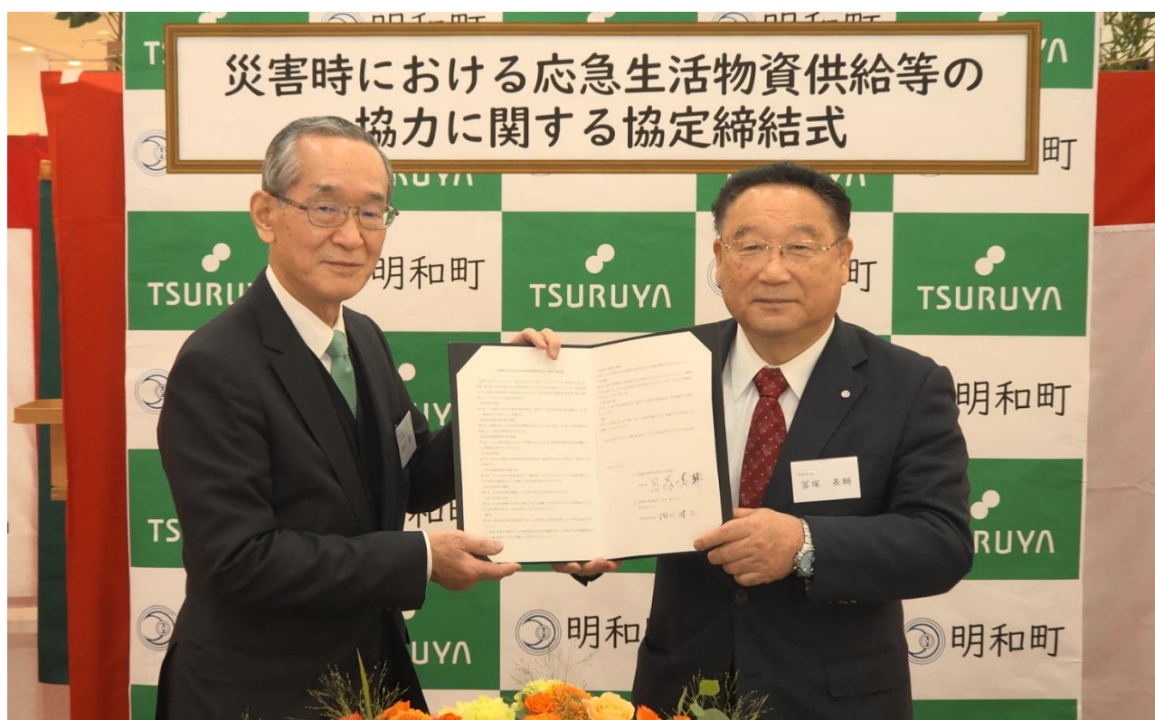
【(株)ツルヤ掛川社長と私】

また、「災害時における応急生活物資供給の協力に関する協定」を締結し、有事の際には食料品や日用品などの生活物資を優先的に供給していただきます。迅速かつ円滑に必要な物資を確保し、被災者に提供できる体制を整えることが可能になり、防災力の向上に繋がりました。