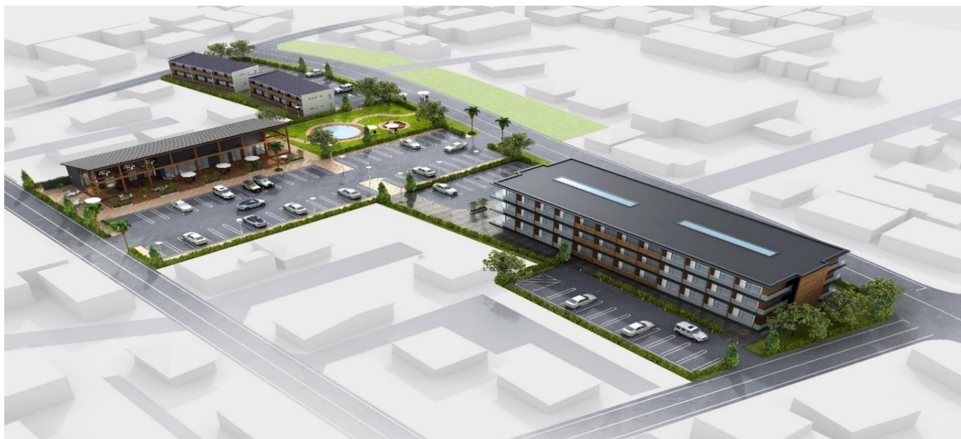
【日本基礎ビレッジ(イメージ図)】

り利用を想定した個室浴場2棟を予定しております。2027年春の開業を目指してまいりますので、ぜひ、楽しみにお待ちしております。