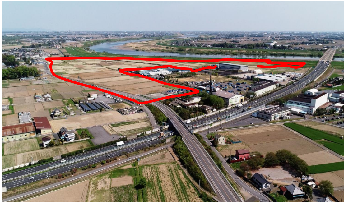
【45 haの東部工業団地(赤線内)】