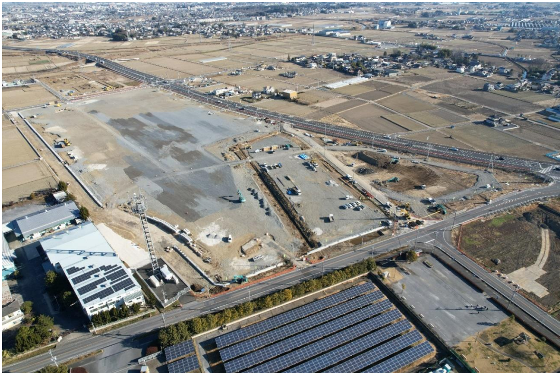
【矢島地内 集客施設の造成模様】

国道122号バイパスの集客施設にも土地の造成引き渡しを行い、夏頃には建設の共同記者会見を行ってまいります。