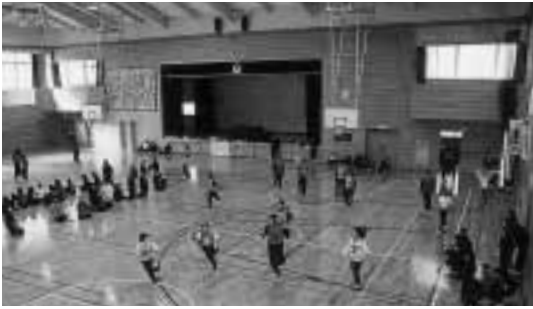
生涯スポーツの拠点：西小屋内運動場

この公表は、財政概要の作成及び公表に関する条例（町条例第35号）に基づき、町の財政状況がどのようになっているのかを、町民の皆さんにお知らせするものです。今回は、平成13年度（平成14年3月31日現在）の予算執行状況をお知らせします。 なお、出納整理期間が5月31日までとなっておりますので、決算額と異なります。決算額は、広報めいわ10月号でお知らせします。平成13年度は、西小学校屋内運動場改築工事をはじめ、IT革命に対応した情報化施策の推進、行政区域活性化事業、特別養護老人ホーム建築補助事業、広域公共バスの運行事業など各分野の事業を積極的に行ってまいりました。