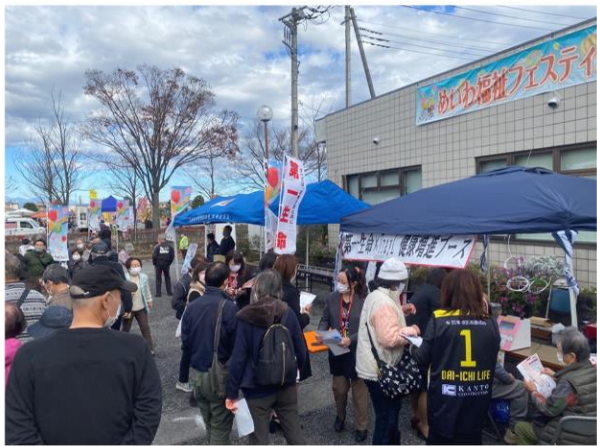
めいわ福祉フェスティバル