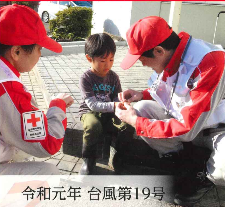
令和元年 台風第19号

赤十字はこれからも「救うこと」を続けます 赤十字活動資金へのご協力をお願いいたします