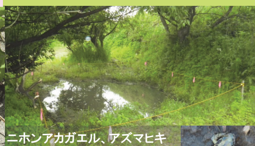
ニホンアカガエル、アズマヒキガエル等の産卵場となっている他、ドジョウなども生息、湿生植物も生育しています。