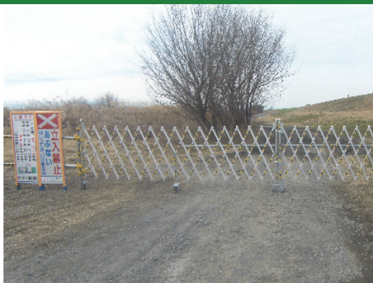
車両進入防止バリケードの設置