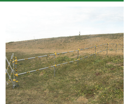
堤防法面への立入防止柵の設置