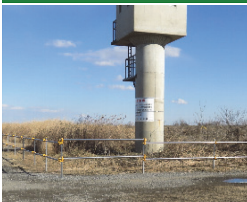
立入防止柵の設置